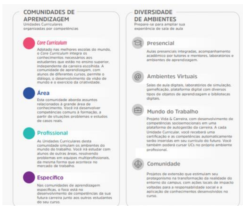
Figura 1 – Comunidades de aprendizagem e diversidade de ambientes

A flexibilidade do Currículo Integrado por Competências permite ao estudante transitar por diferentes comunidades de aprendizagem alinhadas aos seus respectivos eixos de formação. O percurso formativo é flexível, fluído, e ao final de cada unidade curricular o aluno atinge as competências de acordo com as metas de compreensão estudadas e vivenciadas ao longo do semestre.