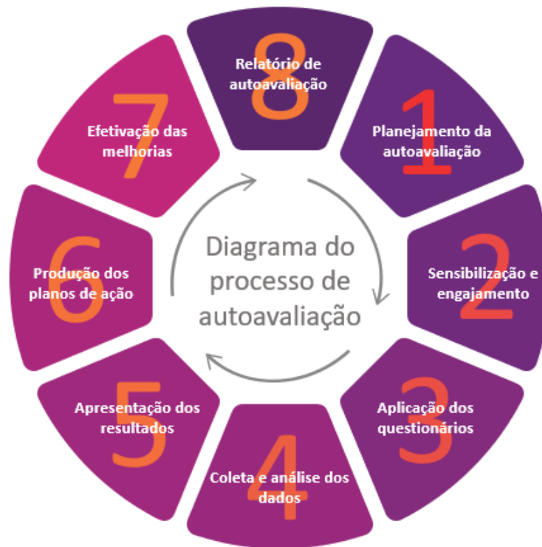
Figura 4 – Diagrama do Processo de Autoavaliação

O processo de autoavaliação do Centro Universitário Ritter dos Reis foi idealizado em oito etapas, previstas e planejadas para que seus objetivos possam ser alcançados, conforme explicitado a seguir.