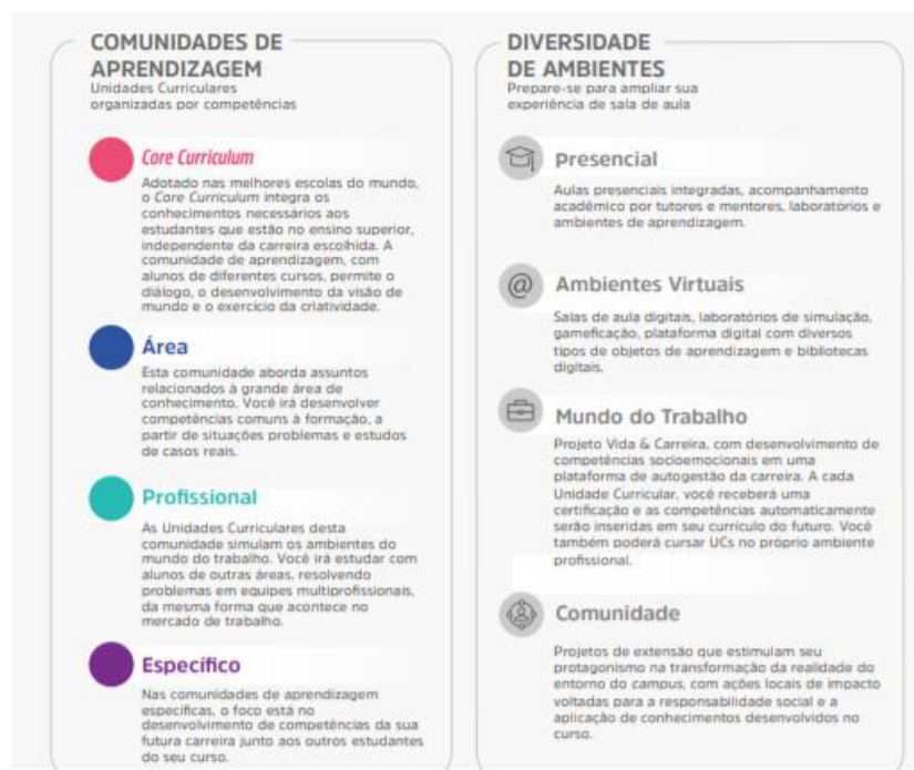
Figura 1 – Comunidades de aprendizagem e diversidade de ambientes

A flexibilidade do Currículo Integrado por Competências permite ao estudante transitar por diferentes comunidades de aprendizagem alinhadas aos seus respectivos eixos de formação. O percurso formativo é flexível, fluído, e ao final de cada unidade curricular o aluno atinge as competências de acordo com as metas de compreensão estudadas e vivenciadas ao longo do semestre.