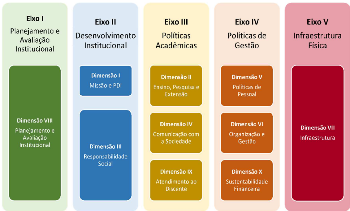
Figura 2 – Eixos e dimensões do SINAES

Essa autoavaliação, realizada em todos os cursos da IES, a cada semestre, de forma quantitativa e qualitativa, atenderá à Lei do Sistema Nacional de Avaliação da Educação Superior (SINAES), nº 10.8601, de 14 de abril de 2004. A legislação irá prever a avaliação de dez dimensões, agrupadas em 5 eixos, conforme ilustra a figura a seguir.