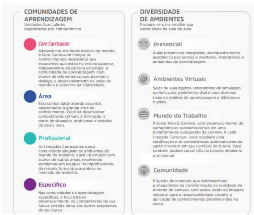
Figura 1 – Comunidades de aprendizagem e diversidade de ambientes

A flexibilidade do Currículo Integrado por Competências permite ao estudante transitar por diferentes comunidades de aprendizagem alinhadas aos seus respectivos eixos de formação. O percurso formativo é flexível, fluído, e ao final de cada unidade curricular o aluno atinge as competências de acordo com as metas de compreensão estudadas e vivenciadas ao longo do semestre.