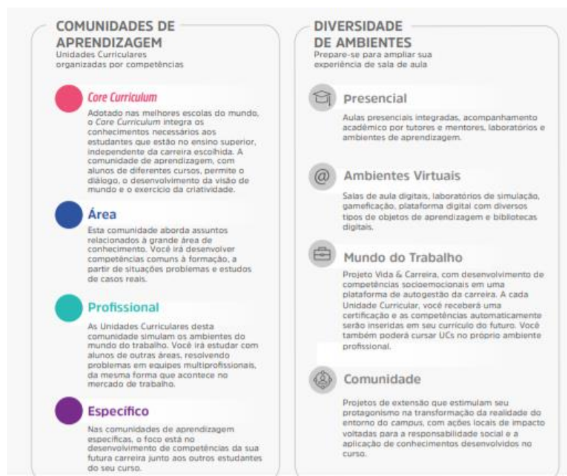
Figura 1 – Comunidades de aprendizagem e diversidade de ambientes

A flexibilidade do Currículo Integrado por Competências permite ao estudante transitar por diferentes comunidades de aprendizagem alinhadas aos seus respectivos eixos de formação. O percurso formativo é flexível, fluído, e ao final de cada unidade curricular o aluno atinge as competências de acordo com as metas de compreensão estudadas e vivenciadas ao longo do semestre.