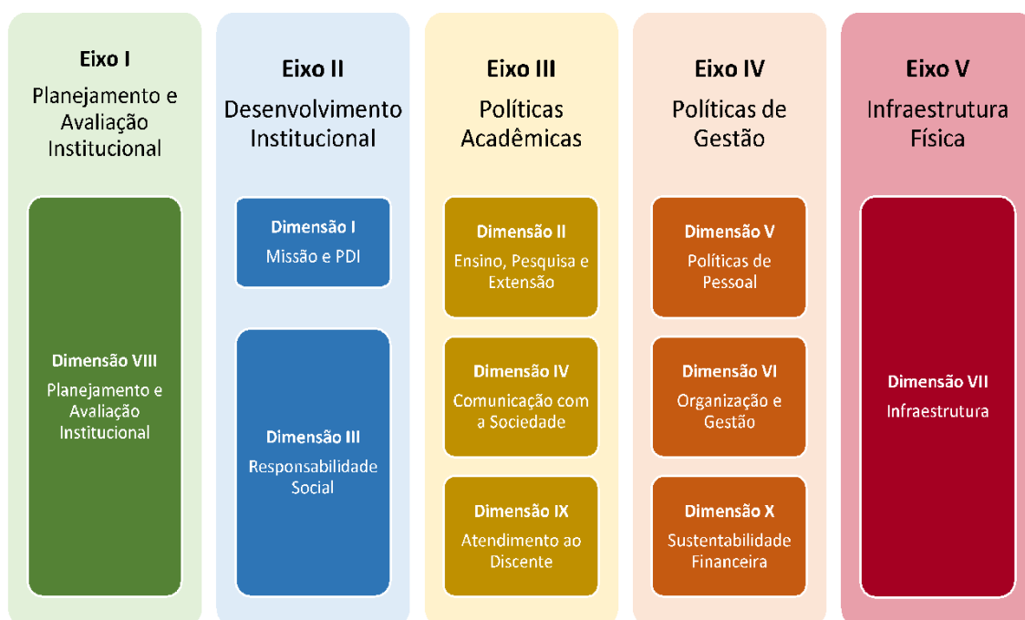
Figura 1 – Eixos e dimensões do SINAES

Essa autoavaliação, realizada em todos os cursos da IES, a cada semestre, de forma quantitativa e qualitativa, atenderá à Lei do Sistema Nacional de Avaliação da Educação Superior (SINAES), nº 10.8601, de 14 de abril de 2004. A legislação irá prever a avaliação de dez dimensões, agrupadas em 5 eixos, conforme ilustra a figura a seguir.