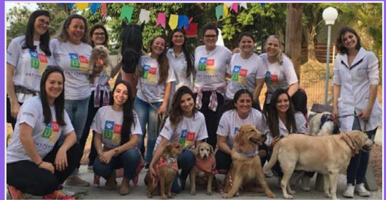
Atividade de Pet Terapia envolvendo estudantes de sete cursos: Veterinária, Biomedicina, Nutrição, Farmácia, Enfermagem, Fisioterapia e Psicologia

Oficinas de elaboração de Currículo Lattes e entrevista de emprego são realizadas para os estudantes do curso de Medicina Veterinária da UniRitter, além de rodas de conversa com recrutadores de recursos humanos de grandes instituições de Porto Alegre.