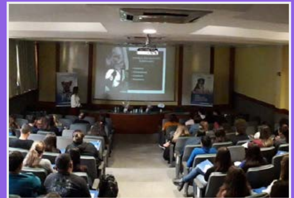
Palestra da Liga sobre clínica de pequenos animais em um dos auditórios do campus FAPA