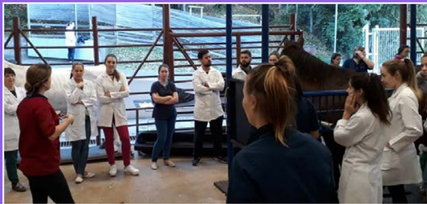
Aula no Pavilhão de Grandes Animais

Localizado dentro do campus Fapa da UniRitter, o Pavilhão de Grandes Animais tem estrutura que visa ampliar a vivência dos alunos do curso de Medicina Veterinária, oferecendo um novo espaço com baias, estrutura destinada ao desenvolvimento de habilidades e práticas com animais de grande porte. Essa estrutura específica visa desenvolver as competências dos alunos com atividades relacionadas aos grandes animais e pequenos ruminantes.