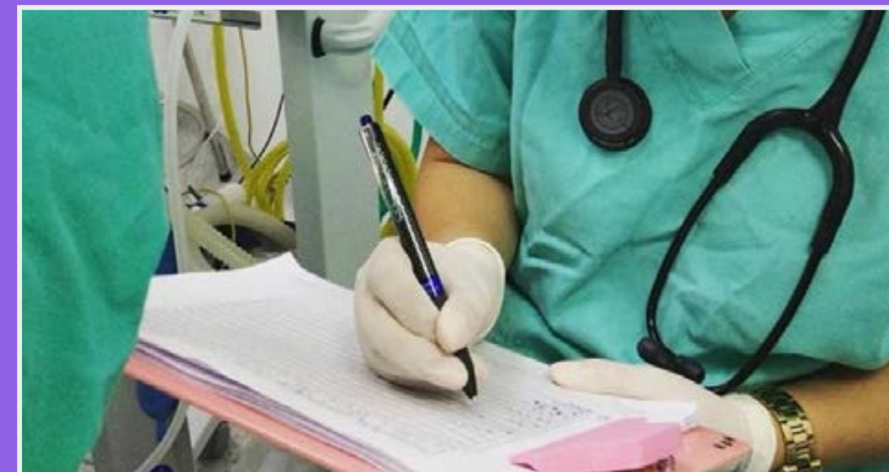
Monitoramento anestésico realizado durante aula no Hospital Veterinário