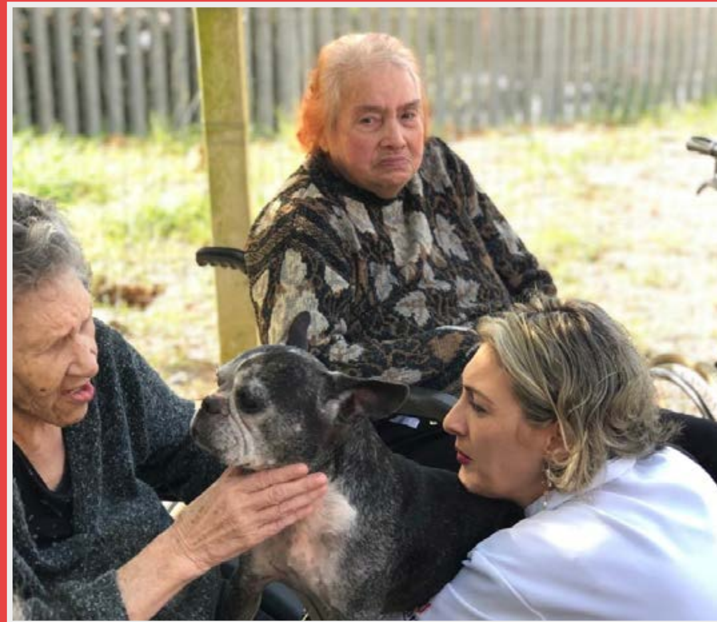
Atividade do curso de Medicina Veterinária no Lar de Idosos Gustavo Nordlund

Acadêmicos do curso de Medicina Veterinária realizam visitas, levando animais, como cavalos e cães, ao Lar de Idosos Gustavo Nordlund, localizado no bairro Rubem Berta, na região do Campus Fapa. O projeto é desenvolvido com a proposta de realizar ações multiprofissionais para desenvolver habilidades em perspectiva colaborativa.