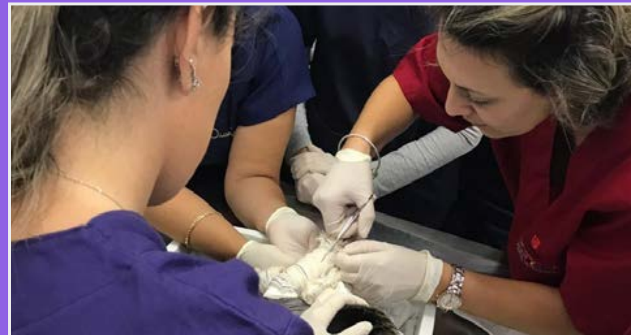
Aula de Clínica de Pequenos Animais no Hospital Veterinário

O Hospital Veterinário oferece consultas, vacinas, cirurgias, procedimentos veterinários em diversas especialidades, além de contar com um centro de diagnóstico que disponibilizará exames complementares por imagem e exames laboratoriais.