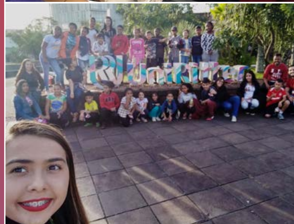
Projeto do curso de Medicina Veterinária no Lar Esperança