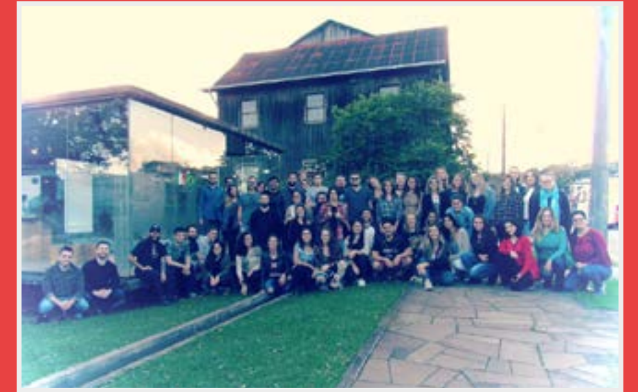
Imigração italiana - A primeira imersão contemplou o circuito da imigração italiana, conhecendo as cidades de Itapuca, Arvorezinha e Ilópolis.