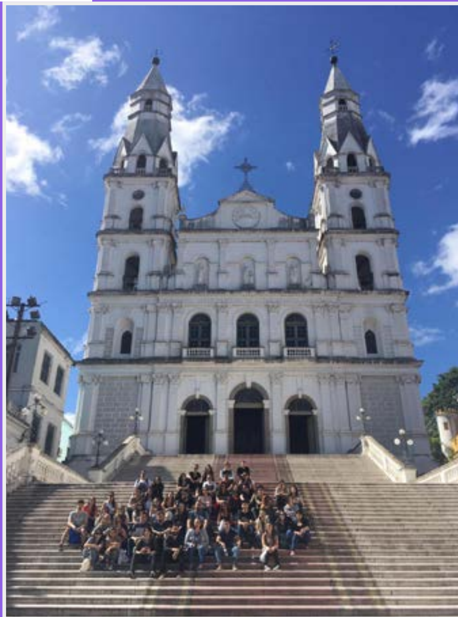
Estudantes de Arquitetura e Urbanismo da UniRitter visitam a Igreja das Dores em Porto Alegre (RS)

O bom ensino de Arquitetura e Urbanismo se dá pela resolução de problemas através da pesquisa, análise de dados da realidade, elaboração de hipóteses de trabalho e proposição de soluções possíveis. Por isso, 60% da carga horária total do curso são disciplinas práticas, onde o conhecimento se constrói através da resolução de problemas da sociedade contemporânea