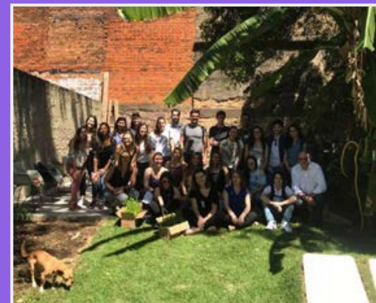
Estudantes de Arquitetura e Urbanismo participam de workshop sobre hortas urbanas