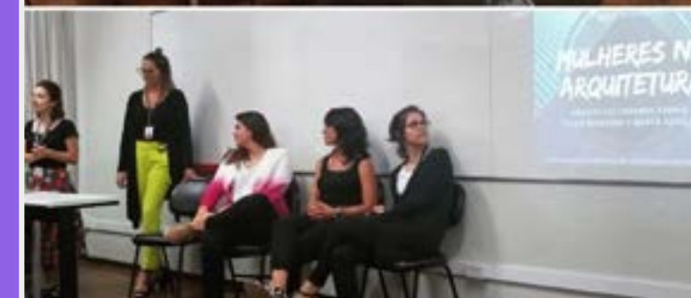
Estudantes e profissionais discutem o tema mulheres na Arquitetura