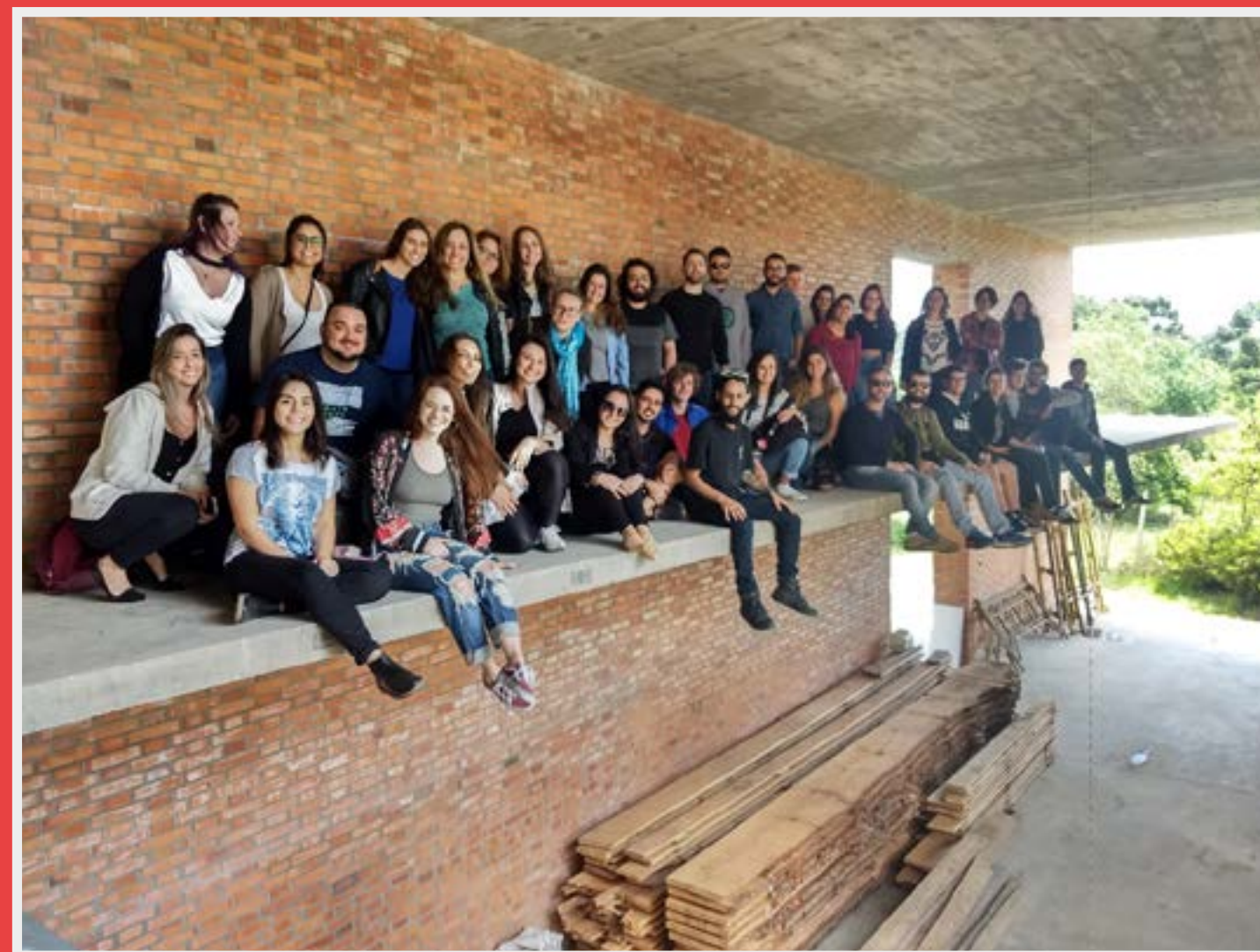
Alunos da disciplina de Patrimônio e Restauro do curso de Arquitetura e Urbanismo do Centro Universitário Ritter dos Reis (UniRitter)