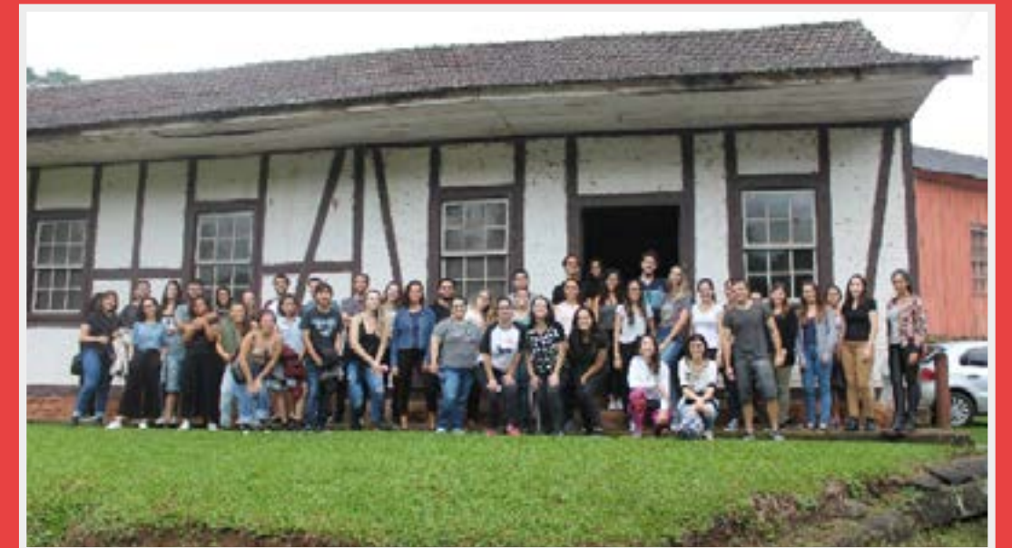
Portugueses e alemães - A segunda imersão contemplou o circuito da colonização luso-açoriana e germânica, conhecendo as cidades de Cachoeira do Sul, Rio Pardo, Santa Cruz e Sinimbu.