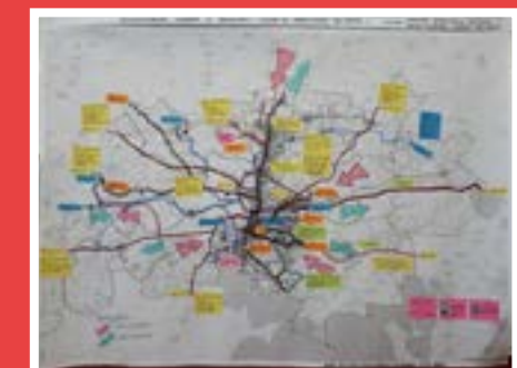
Aulas em ateliê utilizam metodologias ativas no curso de Arquitetura e Urbanismo da UniRitter