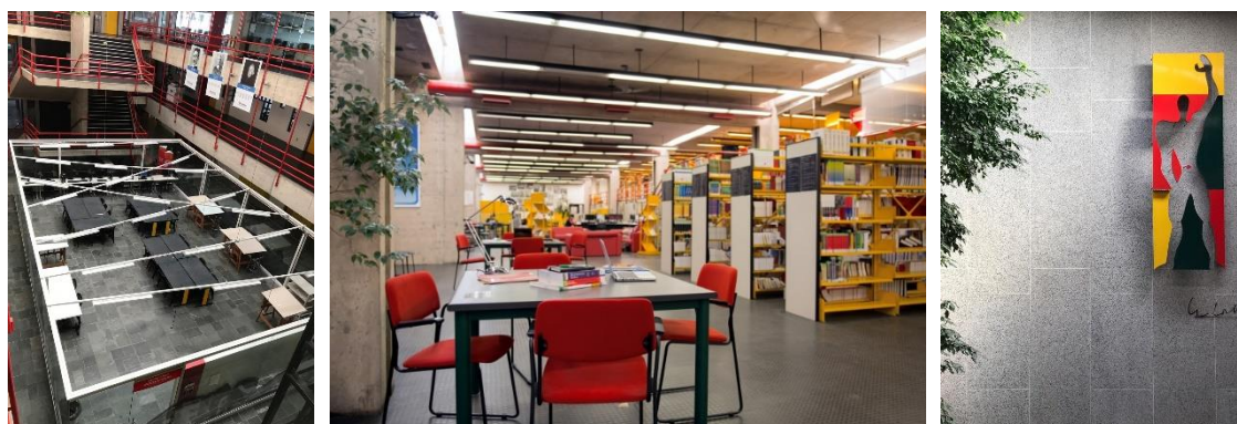
Figura 1: Arquitetura e características do Campus Zona Sul

O Edifício A que hoje concentra a maior parte das atividades do curso de Arquitetura e Urbanismo no campus da Zona Sul foi concebido excepcionalmente para abrigar o curso e suas atividades específicas, guardando em sua arquitetura características especiais, que por décadas contribuíram para a formação da identidade do curso, tornando-se um marco da formação dos alunos e um dos principais atrativos acadêmicos, pois a vivência em um edifício projetado especialmente para abrigar a faculdade de arquitetura proporciona experiências verdadeiramente marcantes (Figura 1).